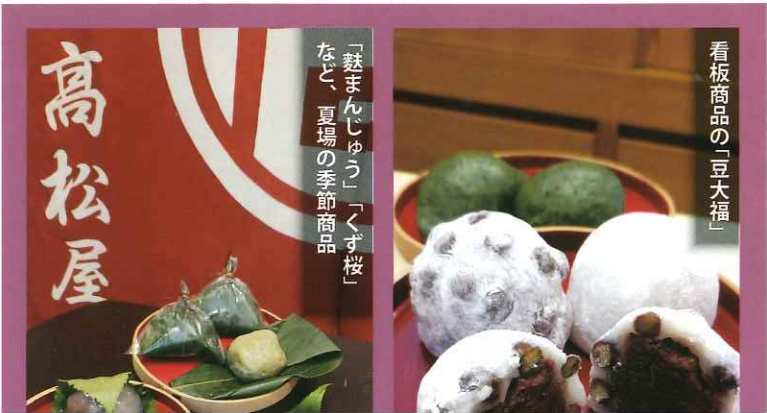
看板商品の「豆大福」

「和菓子の魅力いく季節を五感もふらっと立ち寄も気軽に買える様に愛されるおす」と語る店主が込められた、和菓子である。