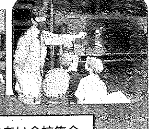
ふれあい全校集会