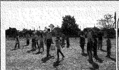
土の子わくわくたいけんフェスティバル