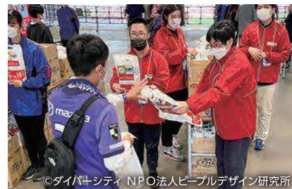
昨年JリーグYBCルヴァンカップ 決勝の就労体験の様子