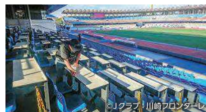
スタジアムでの就労体験の様子