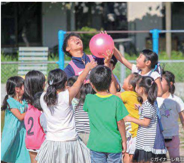
地域の学校とのふれあいの様子