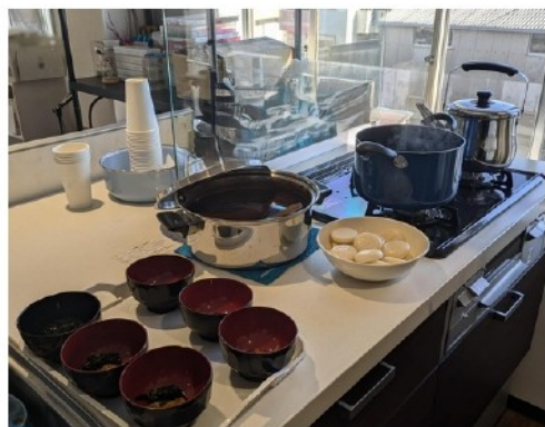
鏡開きした餅の調理風景

あんこが苦手な方はそのままや醤油をかけて食べるなど多様な味付けをして社員一同鏡開きを楽しみました。