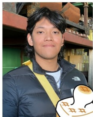
餅つきに参加したDさん