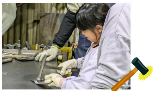
板金体験をしている少女

11月2日にあやせ工場オープンファクトリー吉岡エリアが開催され、参加企業が工場の門を開き、一般の皆様へ見学や体験などを行いました。弊社では、工場見学（レーザー加工や溶接など）と曲がった金属をハンマーで平らにならす『板金体験』をしていただきました！