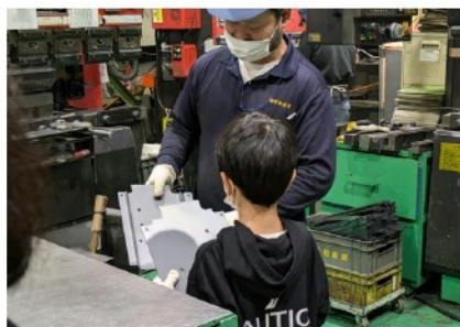
曲げの加工がされた部品を手に取る少年