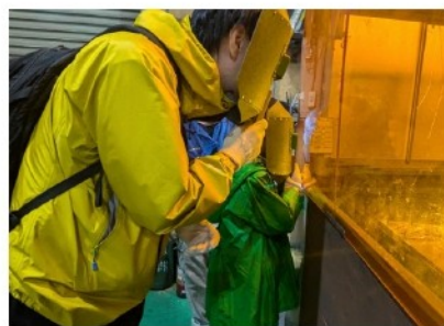
ロボット溶接を見学する親子