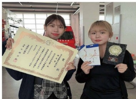
優良賞を受賞したKさんとYさん