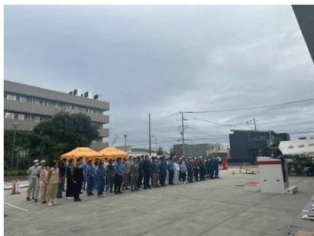
初期消火大会 開会式

感想：こういった貴重な体験をさせていただいたので いざという時に自分から積極的に動けるようになりたいです