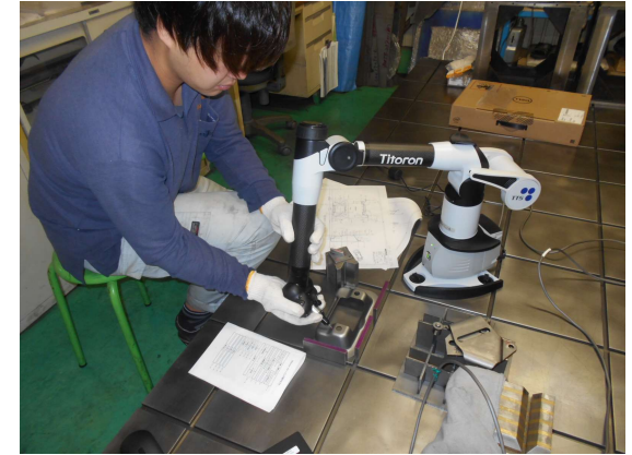
三次元測定機 タイトロン