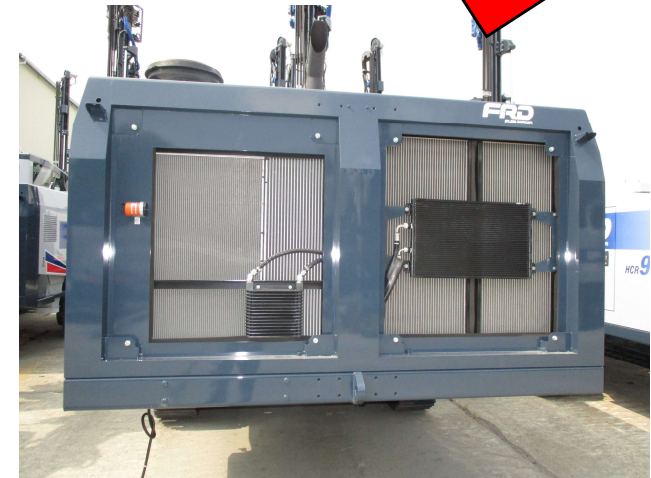
クローラドリル リアカバー リニアモーターカー開通工事の クローラドリルに搭載されていて、 幅が約2.4mある製品です