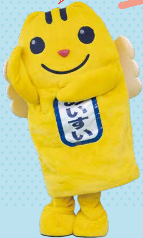
「選挙のめいすいくん」は、明るい選挙推進運動のイメージキャラクターです。

3～5月に任期が満了する地方自治体の首長と議会議員を全国一斉に改選するため、4月9日と23日の2回に分けて行う選挙です。 「令和」改元後初の統一地方選挙です。 ※綾瀬市長の任期満了は6年7月です。