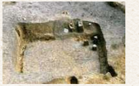
奈良三彩が出土した早川城山遺跡のBH1号住居跡

奈良三彩の破片は、とても小さいものですが、破片一つから本地域の歴史を紐解くヒントを得ることができます。早川城山遺跡から出土した「奈良三彩小壺の蓋」を市役所3階文化財展示コーナーで展示していますので、ぜひご覧ください。