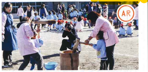
綾瀬幼稚園のもちつき ※動画でみこしの様子が見られます

もちつき今年はおもち30kg分を使い、見学に訪れた未就園児の保護者にも振る舞われた。もちつきが行われた。同園でも、せいろで蒸したもち米を使い、臼と杵で園児たちが順番に体験。最後には綾瀬幼稚園恒例の「子どもみこし」が園の周りを練り歩き「わっしょい！わっしょい！」という園児たちの元気な声が響き渡った。